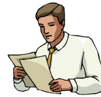
ის საბაა. That Saba is.